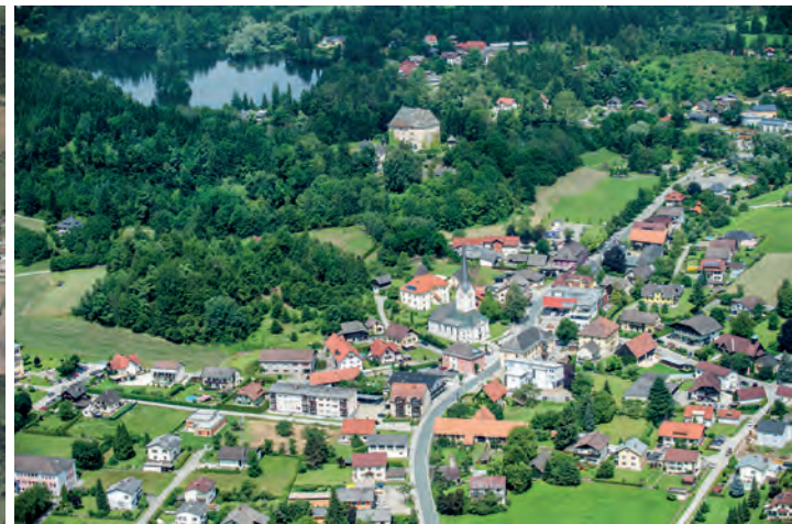
Siedlungsentwicklung Moosburg – St. Peter 1953 bis heute