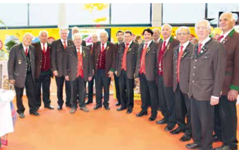
Der Männergesangsverein Moosburg begeisterte mit einem tollen Repertoire.