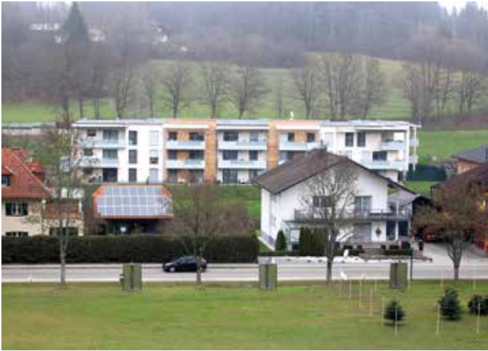
Die Wohnhausanlage wurde im Zentrum errichtet und ist ein bedeutender Beitrag für die Stärkung des Ortskerns.