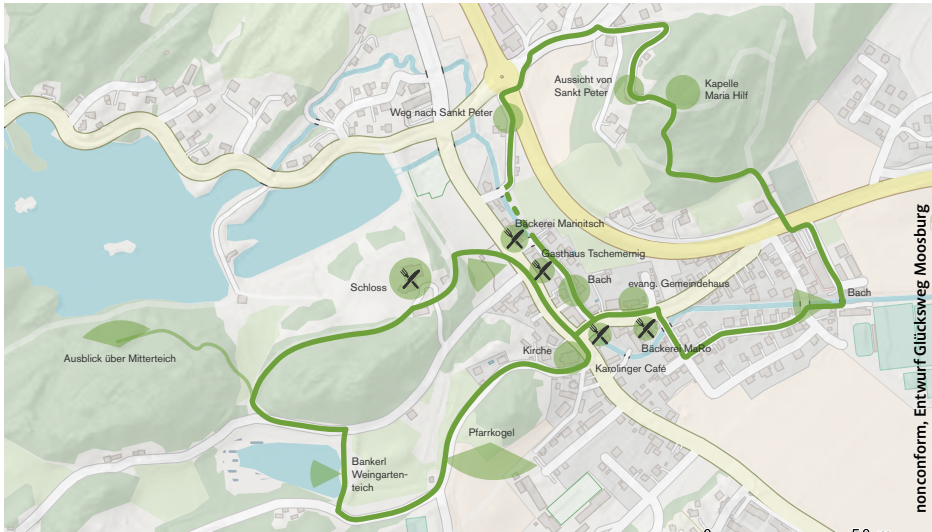
nonconform, Entwurf Glücksweg Moosburg

dem Glück, aber die Gier in ihnen, es zu erjagen, bringt sie gerade um das, was sie sehnlichst wünschen.“