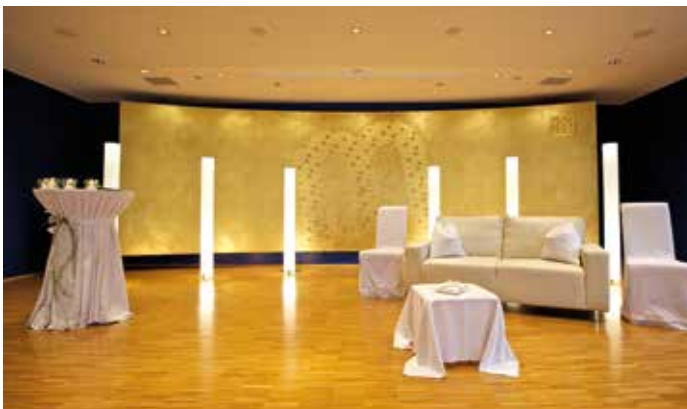
Heiraten in Moosburg: Der Karolinger Saal in seiner schönsten Pracht.