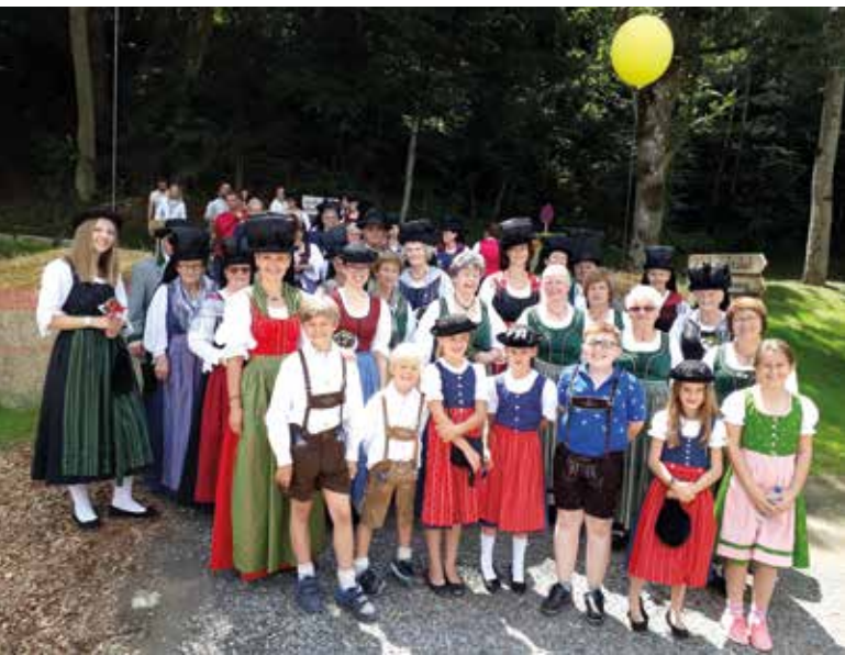
Die Trachtengruppe Tigring beim Arnulfsfest.