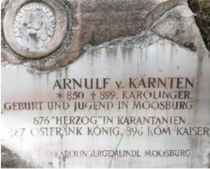
Arnulf von Kärnten ist der Namenspatron für unser alljährliches Fest.