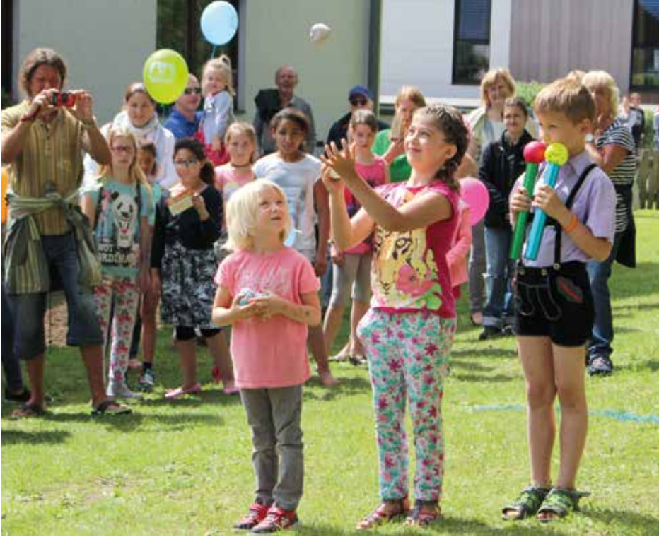
Das Kinder- und Familienfest im SOS Kinderdorf ist immer ein besonderes Erlebnis. Am 16. Juni 2019 findet das Fest zum 43. Mal statt.