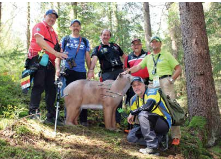
Der 3D-Braunbär wurde erlegt: Waidmannsheil den Schützen!