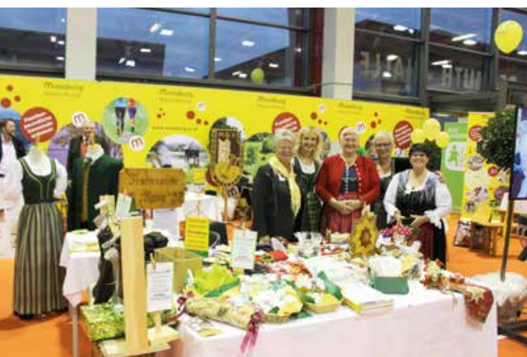
Die Trachtengruppe Tigring präsentierte sich mit der Moosburger Tracht und bot Naturprodukte an.