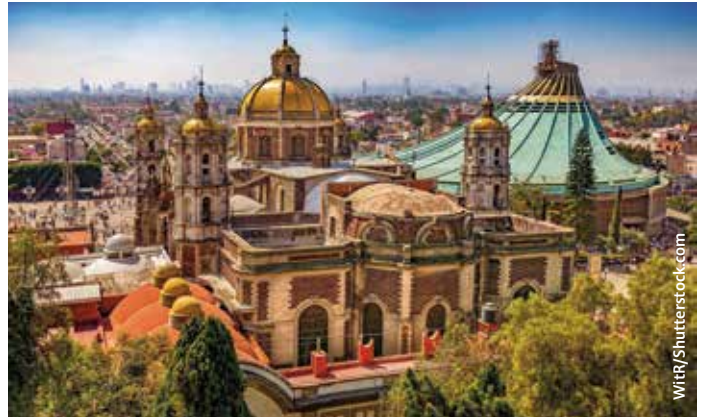
Stadtbild von Mexico City.

schönsten Museen der Welt gezählt werden kann. Darüber hinaus gibt es Restaurants, Parks, künstliche Seen, riesige historische Ausgrabungsstätten mitten in der Stadt sowie die weltberühmte Kathedrale von Mexiko, die mit ihren riesigen Ausmaßen an der Stirnseite des Zócalo steht, des angeblich größten Platzes der Welt.