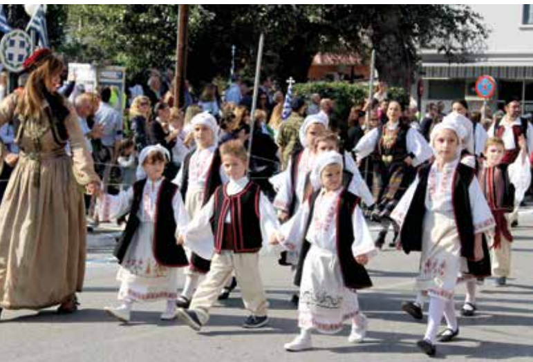
Mit Kind und Kegel: Viele Tanz- und Folkloregruppen waren beim großen Festzug in Katerini dabei und feierten den 108. Unabhängigkeitstag.