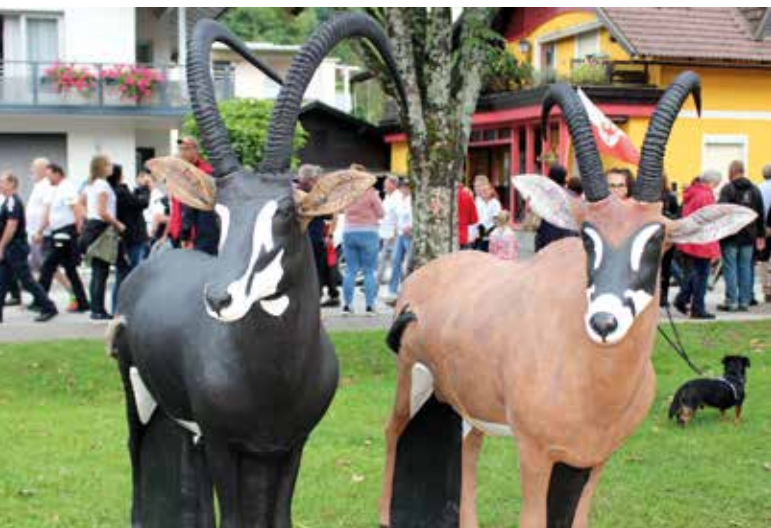
Exotische Tiere auf der Moosburger Schlosswiese.