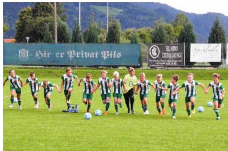
So sieht pure Begeisterung aus: Unsere Nachwuchskicker (im Bild: die U12) geben bei jedem Spiel ihr Bestes – und feiern ihre Siege enthusiastisch.

In diesem Sinne wünschen wir allen Moosburgerinnen und Moosburgern ein frohes Fest, schöne Weihnachtsfeiertage und einen guten Rutsch ins neue Jahr! Text & Fotos SV Moosburg