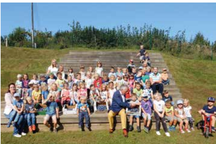
Gesund und Munter: Die Kids in ihrer Arena.