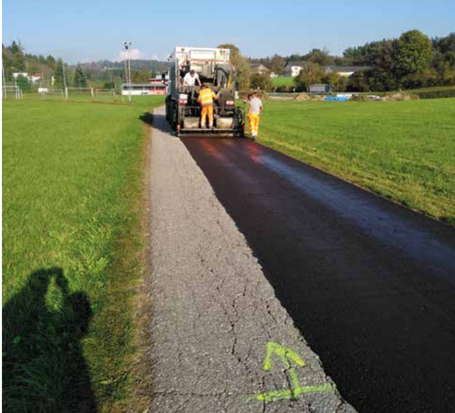
Mit einem neuen Kaltasphaltverfahren wurden die Straßen saniert. Im Bild: Kreggaber Straße.