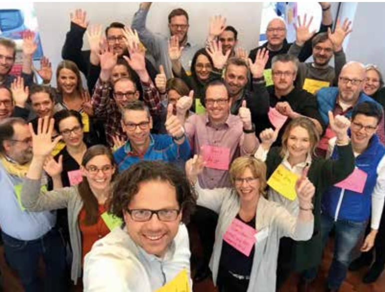
Das nonconform-Prinzip: Ideenentwicklung muss echten Spaß machen. So wie hier. Derzeit ist das nonconform-Team für die Regionale 2025 in Nordrhein-Westfalen aktiv. Das ist ein Innovationslabor für zukünftiges Leben am Land im Zeitalter der Digitalisierung.