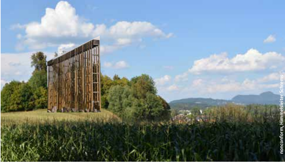
nonconform, Himmelsteiler Schrems