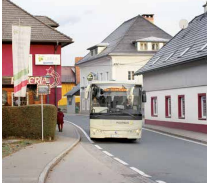
58 Verbindungen täglich! Kein Stress, keine Parkplatzsuche! Mit dem Bus nach Klagenfurt und retour!

Man darf auch nicht außer Acht lassen: Unsere Bevölkerung wird immer älter. Kinder wohnen nicht selten weit entfernt von Ihrem Elternhaus. Mit fortgeschrittenem Alter wird die Möglichkeit, sich für alltägliche Erledigungen in seinem Umfeld frei bewegen zu können, zum besonders wertvollen Gut. Man will sich Selbständigkeit erhalten, und