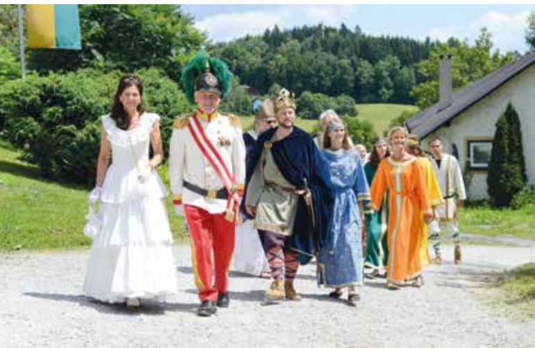
Kaiser & Kaiserin: Franz Josefs und Arnulf zieht mit Gefolge ins Schloss.