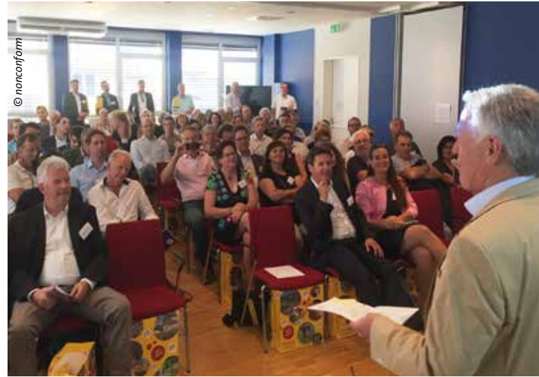
Moosburg als Austragungsort der internationalen Ortskernkonferenz.

Die Ideen zur Belebung und Stärkung des Ortszentrums wurden Ende November bei einer Bürgerkonferenz vorgestellt und diskutiert.