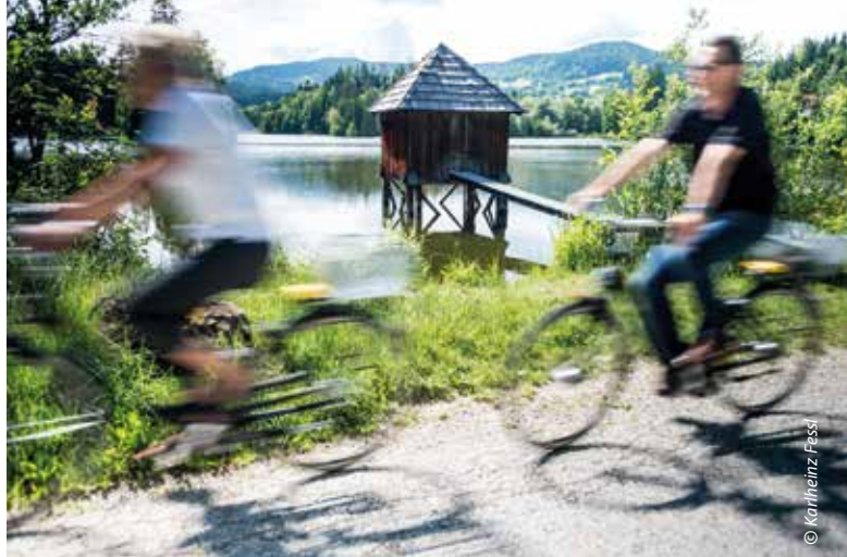
Alle (Rad)Wege führen nach Moosburg.