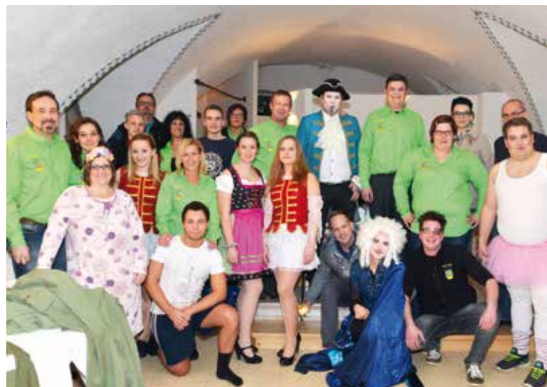
Die Faschingsgilde zu Moosburg freut sich auf Ihren Besuch