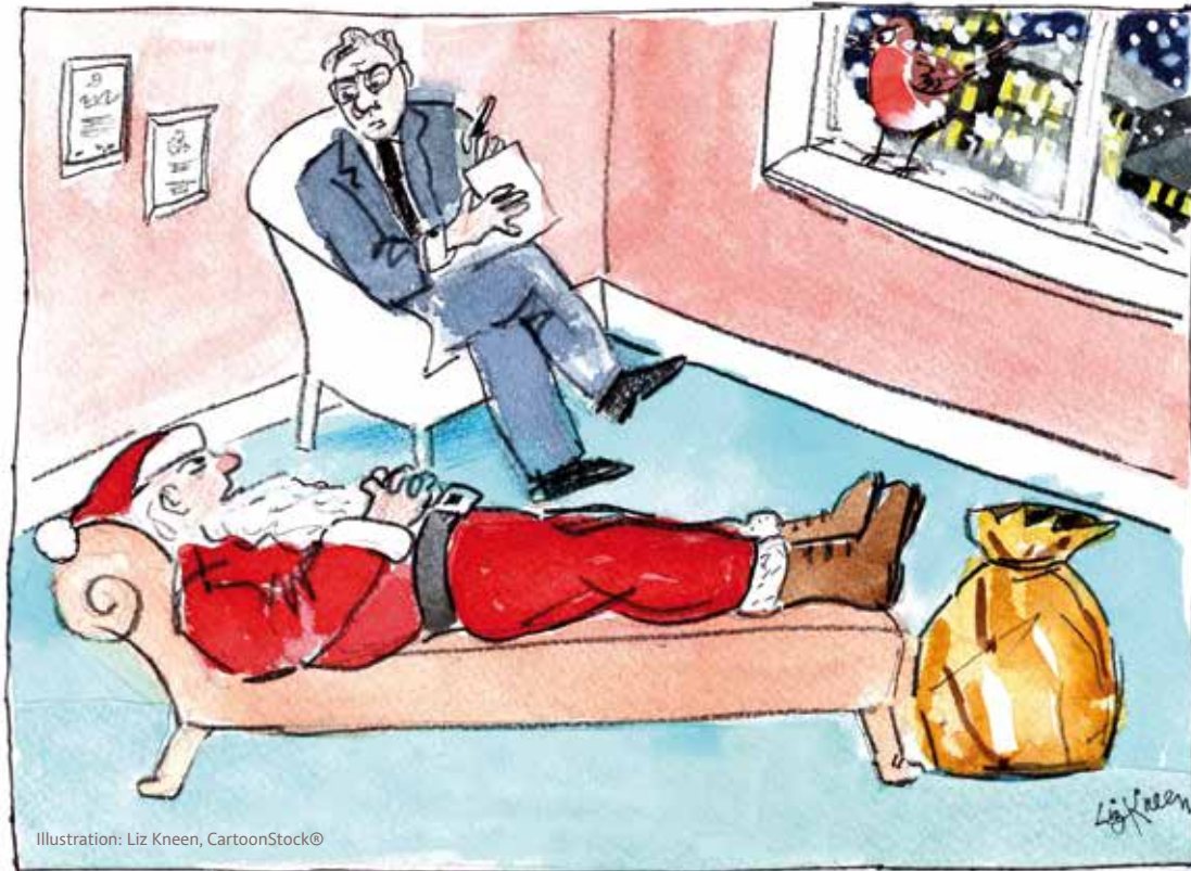
Illustration: Liz Kneen, CartoonStock®

Ich weiß, es klingt verrückt ... Aber manchmal habe ich das Gefühl, als würde ich gar nicht existieren.